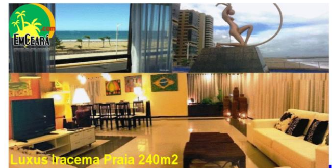
Luxus Iracema Praia 240m2

Diária para temporadas Baixa 590,00 R$ / Alta 690,00 R$ / Reveillon 2.500,00 R$ MAS VENHA OU AMARELOS