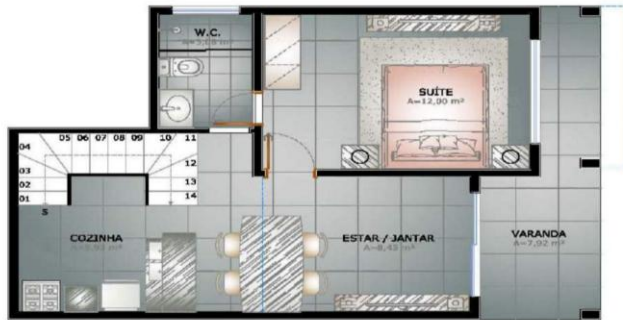
PLANTA BAIXA TERREFO