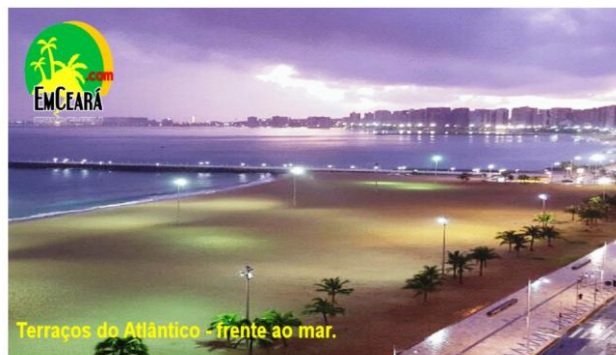
Terraços do Atlântico - frente ao mar.

FORTALEZA - PRAIA DE IRACEMA - FRONTLINE - TERRAÇOS do ATLÂNTICO 3º andar (CNPJ)