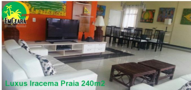
Luxus Iracema Praia 240m2

Diária para temporadas Baixa 590,00 R$ / Alta 690,00 R$ / Reveillon 2.500,00 R$ MAS VENHA OU AMARELOS