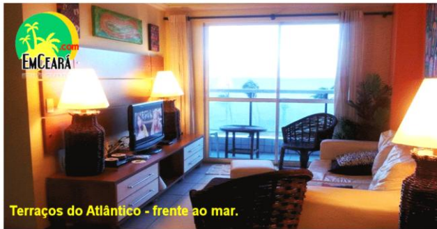
Terraços do Atlântico - frente ao mar.

FORTALEZA - PRAIA DE IRACEMA - FRONTLINE - TERRAÇOS do ATLÂNTICO 3º andar (CNPJ)